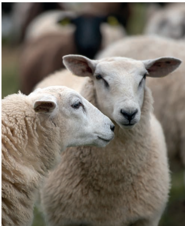
Djur ska skyddas från ”onödigt lidande”, enligt lagen. Men vad är det? Och vilket lidande ska då anses vara nödvändigt?

– Man mäter inte djurvälstånd systematiskt på nationell nivå. Lagstiftningen och föreskrifterna har blivit bättre så då borde välfärden också ha blivit det. Men det skulle behöva utvärderas mer och oftare; vad blir välfärdskonsekvensen av att vi ändrar föreskrifterna? ■