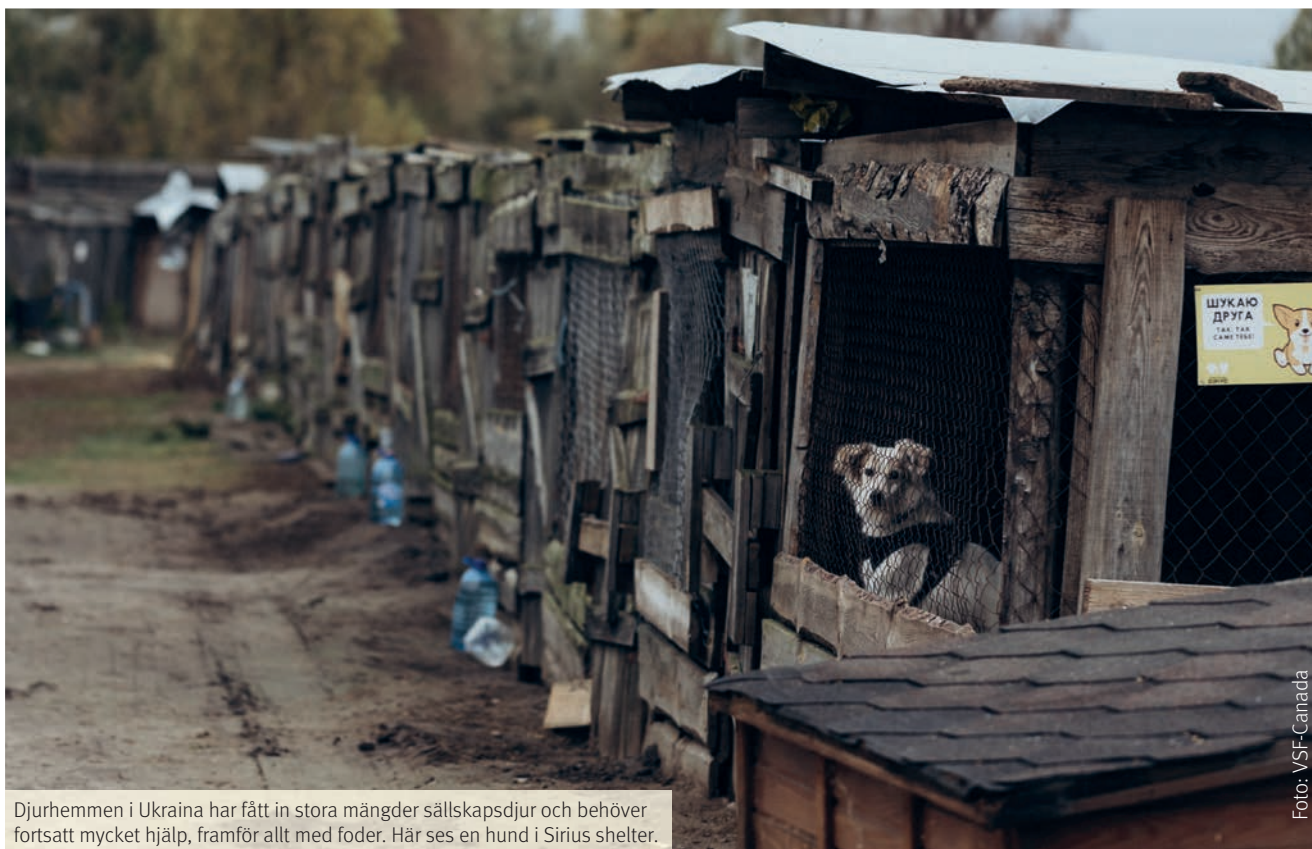
Djurhemmen i Ukraina har fått in stora mängder sällskapsdjur och behöver fortsatt mycket hjälp, framför allt med foder. Här ses en hund i Sirius shelter.