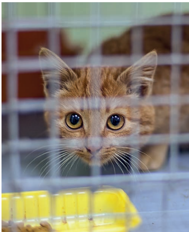
Hot, våld och påverkansförsök gentemot länsstyrelsernas personal har ökat. Framför allt gäller det i ärenden som rör sällskapsdjur.

Länsstyrelserna behöver prioritera försöksdjuren för att leva upp till EU-direktivet.