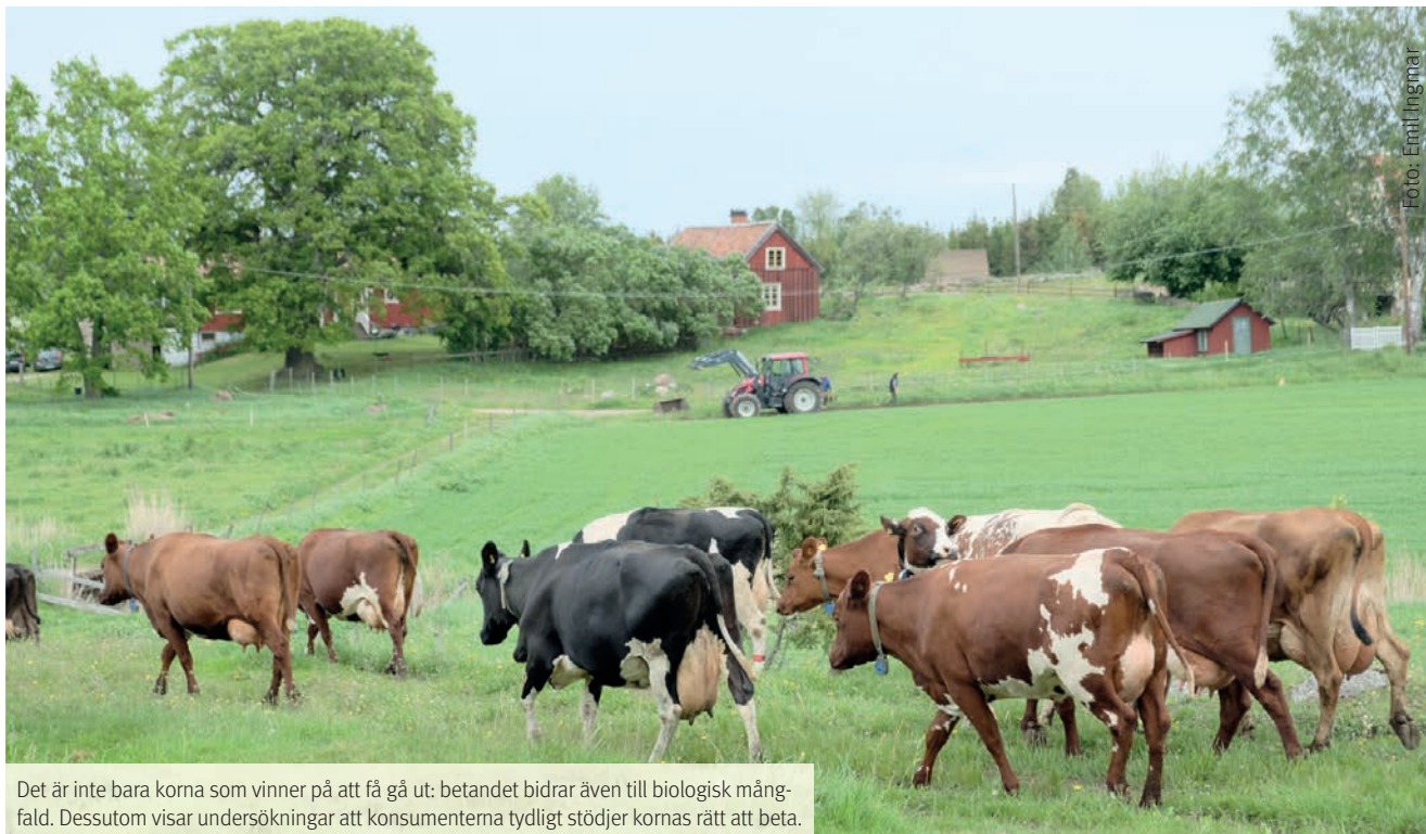
Det är inte bara korna som vinner på att få gå ut: betandet bidrar även till biologisk mångfald. Dessutom visar undersökningar att konsumenterna tydligt stödjer kornas rätt att beta.

– Det är ingen tvekan om att de här påtryckningarna